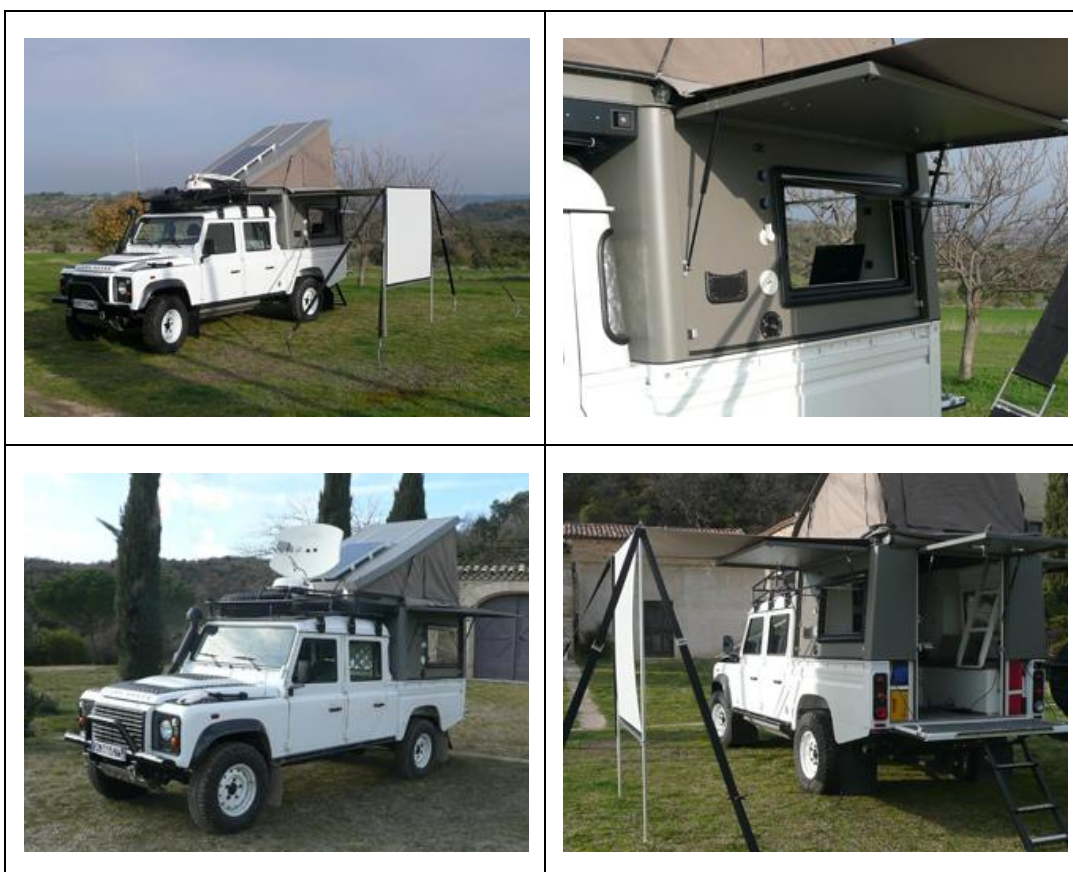
Véhicule de voyage 4x4 Land Rover type Defender 130 avec cellule de vie et équipement de projection vidéo

Le véhicule est équipé de réservoirs supplémentaires de gasoil, d'un autre de 100 litres d'eau, d'une douche, d'un wc chimique, d'amortisseurs et de suspensions renforcées, d'un panneau solaire, d'un groupe électrogène, d'une antenne pour capter Internet via les satellites et de tout l'équipement électrique de montage et de projection vidéo. Le véhicule permet de voyager en toute sécurité à 4 personnes. Même si Gérard FRANCOIS voyage le plus souvent seul, il peut aussi accueillir des amis ou des membres de sa famille pour partager une portion de son voyage.